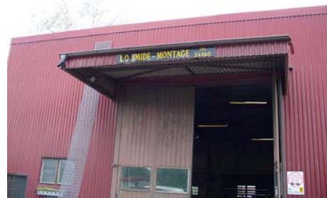
Oran, praktik på LO Smide (ute på uppdrag)

De studerande hade inte bara ett arbete att utföra utan skulle också försöka se sig själva i ett större sammanhang och dra paralleller till det som tagits upp i de många momenten i NÄRMA - projektet och att så var fallet kändes redan vid första praktikbesöket. /BN