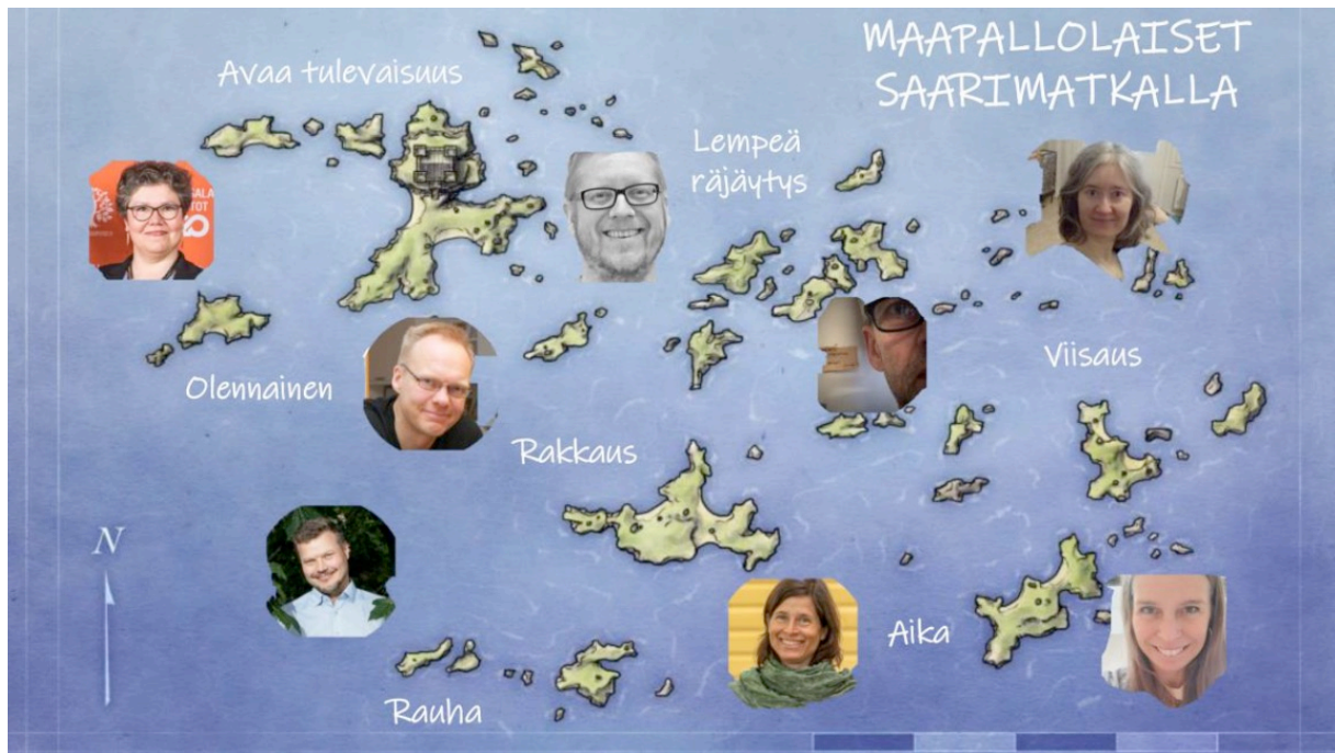
Kuva 6: Maapallolaiset saaristomatalla