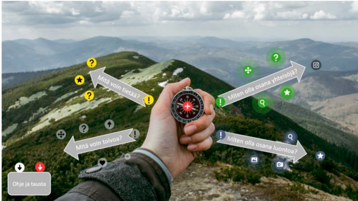
Kuva 4 Sivistyskätköä etsimässä (geo-caching)